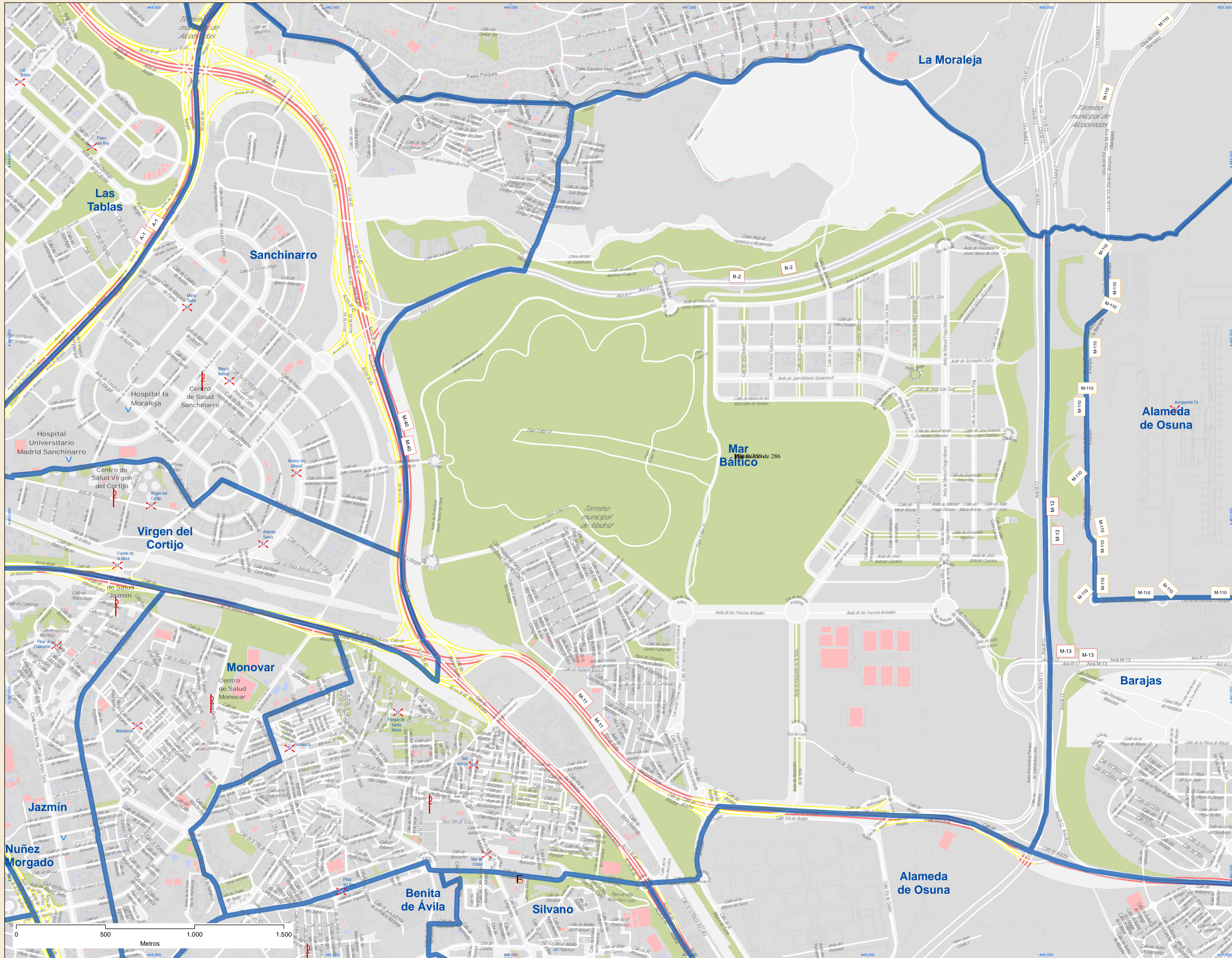
Localización en la Comunidad de Madrid