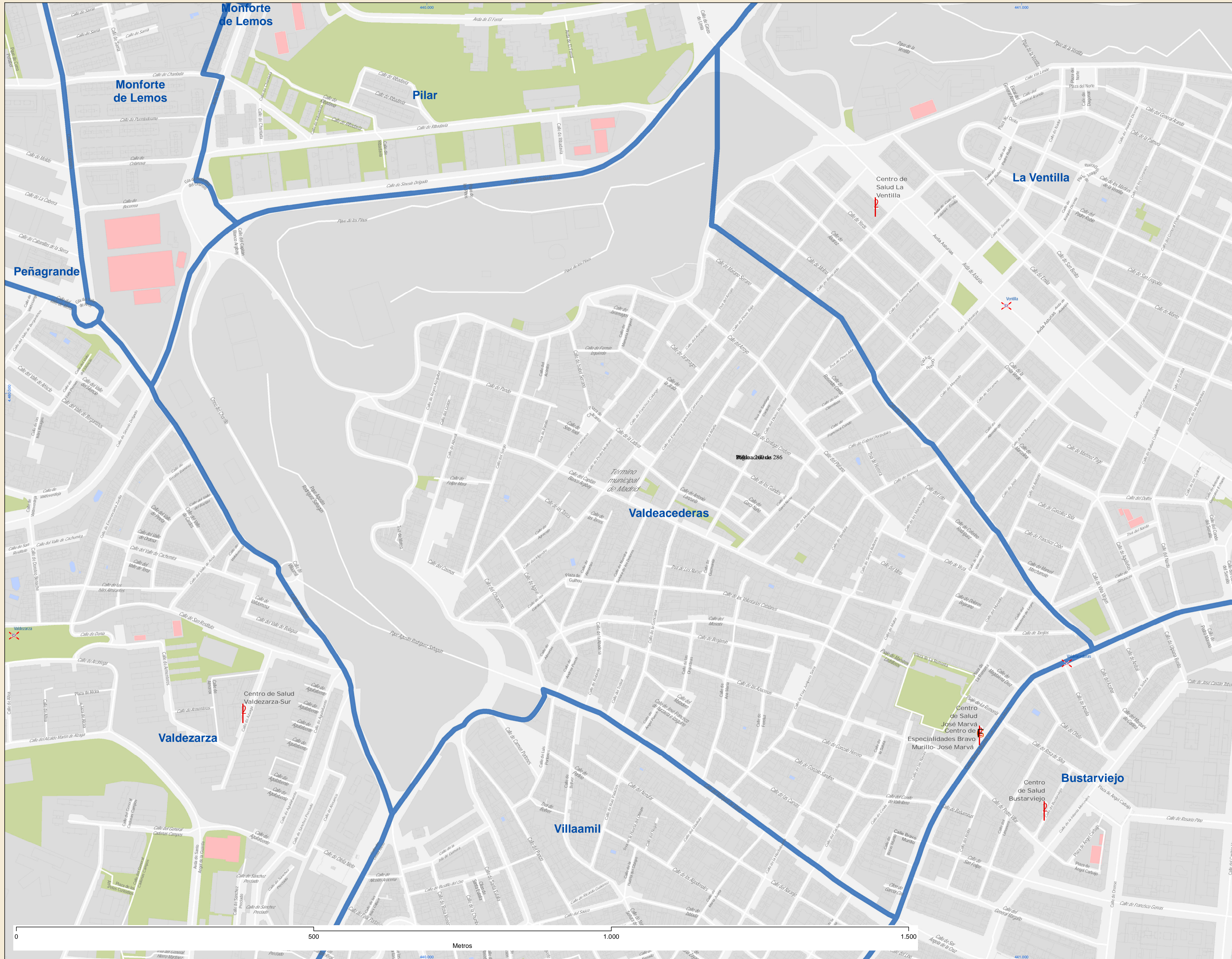
Localización en la Comunidad de Madrid